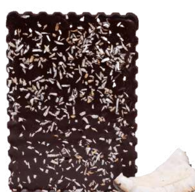
Noix de Coco grillée